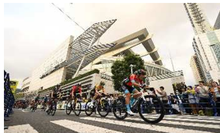
【ツール・ド・フランスさいたまクリテリウム】

さらに、「(一社)さいたまスポーツコミッション」の活動を支援することにより、スポーツを核とする民間力を活用した複合的な事業を通じて、地域の活力を生み出していく必要があります。