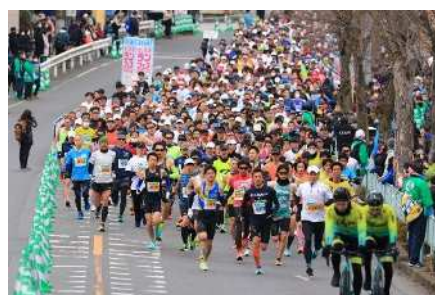
【さいたまランフェス2022-23】